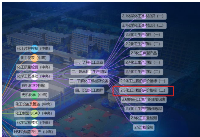
图2 《化工工艺概论》课程树图谱

在课前教学设计环节,充分分析授课班级学情,在新网络学习平台布置学生预习本节课相关知识点,并点亮课程树,如图2。教师针对课程树反馈的学生预习情况,调整课程内容难易程度。