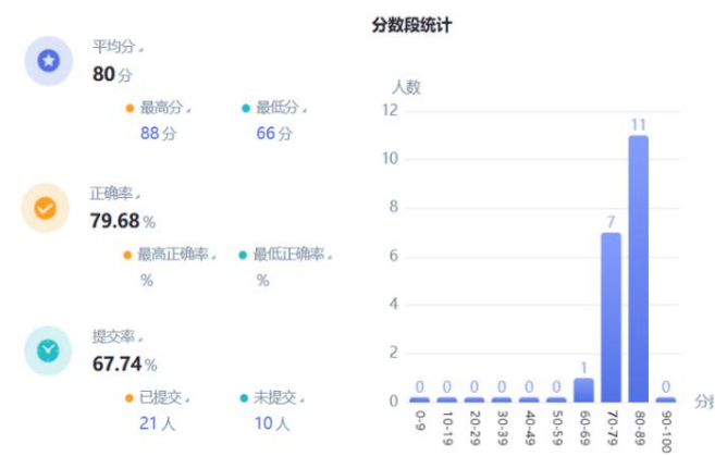
图4 智慧教学分析系统课后作业统计分析

教师在课后将练习题作业通过智慧教学分析系统进行推送，并对其作业进行批改反馈，如图4。学生的历次作业批改记录可以在后台汇总分析，最终形成学生学习分析报告一部分。课后，教师还可以通过智慧课堂软件分析对本节课授课内容进行分析，例如根据学生对“三率”计算回答反馈结果分析，在今后本节课授课中应更加注重主反应中消耗原料量与生成目的产物之间关系转化部分的讲解。