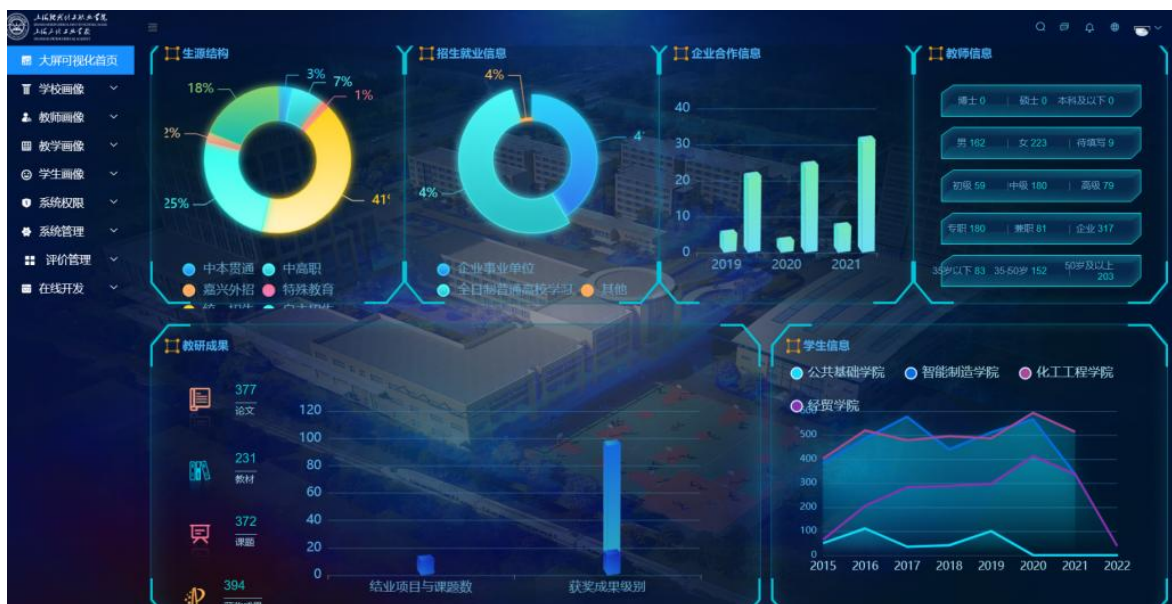
图1 智慧教学分析系统

合，实现教育教学、教育管理和教学精准化的结合创新 [2] 。近年来，各阶段学校积极开展智慧课堂教学及智慧教学分析系统模式探索，但对于职业院校鲜少有其成果在实践应用效果分析。本文将职业院校专业课程《化学工艺基础》为例，阐述智慧教室授课和智慧教学分析系统在课程教学中的应用和优势。