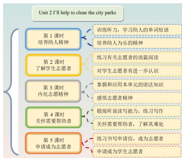
图1 “I'll help to clean up the city parks.” 单元主题意义的建构过程

以人教版八年级（下）Unit 2 I'll help to clean up the city parks. 为例，本单元的主题内容“学生志愿活动”，从语言技能、语言知识、情感态度、学习策略和文化意识等方面对本单元的教学内容和学情进行全面客观分析，制订单元学习目标，将本单元的主题意义建构过程整合为五个课时（见图1）。