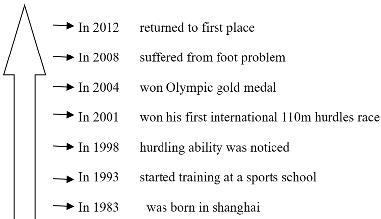
The timeline of Liu Xiang

这个活动除了让学生获取信息的同时，还能进一步理解一般过去时被动语态的意义和用法，并学习一些新的单词和短语。