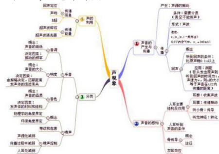
如图1:声现象的思维导图

思维导图具有直观性和全面性。在教学过程中建立思维导图,有利于知识点的全面学习。举例来说明:学生在进行物理学科复习时,倘若只是单纯的翻阅书本知识,那么在复习的过程当中就会存在知识点的遗漏或者整个知识体系框架不清晰的情况。此时我们就可以利用思维导图的直观性,全面性特点去解决这个问题。同样的,老师若在进行教学设计的过程当中建立思维导图,那么他在教学的过程当中就可以抓住知识的主次,进行有重点的讲解。同样的,也可以防止在教学的过程中出现对一部分小的知识点的遗漏。例如下图的声现象思维导图,就全面的展现了整个具体内容。