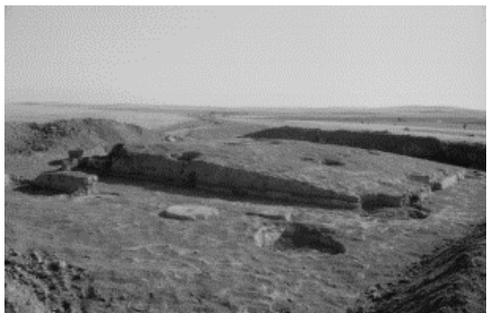
北魏怀朔古城内寺庙遗址

《水经注》记载的石门水，为今昆都仑河，源头为固阳，流经梅令山处有北假屯田的梅令山古城，城东约四十公里处为北魏六镇之首的怀朔镇，为北魏时期阴山地区政治和军事重镇。源于古城之北的五金河由西北墙外由北向南流过，该河两条支流分别穿北墙和东墙入城，于城址西南汇合流出城注入五金河。 [3] 古城址的发现解决了怀朔镇历史上的地理位置问题，对于研究北魏军事重镇设置及时政治、经济、文化等有重要意义，一个世纪的存在见证了北魏王朝兴衰的全部历史。