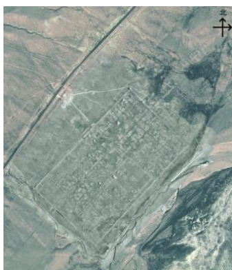
敖伦苏木古城照片

包头域内载入古代史册的两条河流一条为昆都仑河，另一条为艾不盖河。艾不盖河自汉代载入史册，历经两千多年。是一条孕育游牧民族和草原文化，见证中原农耕文化和各民族融合发展的重要河流，是草原人民的生命河。汉代称诺水，唐代称诺真水，辽、金、元时期称黑水，明末、清代称爱布哈河，现称艾不盖河。全长154公里，源于达茂旗明安镇，注入腾格淖尔。元代遗址敖伦苏木古城南临艾不盖河，是汪古部首领赵王世家的府邸，汪古部信奉基督教，属基督教。古城有黑水码头，曾是德宁路所在地。为汪古部领地最大的政治、经济、文化和宗教中心。历史变迁，风雨侵蚀的古城褪去繁华，用残垣断壁见证昔日辉煌。