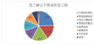
图1 大学生对我国扶贫工程的了解情况

在大学生所了解的扶贫工程中(见图1),有24%为干部驻村帮扶,18%为职业教育培训,16%为异地扶贫搬迁,12%为扶贫小额信贷,12%为电商扶贫,10%为旅游扶贫,7%为光伏扶贫,1%为其他。而对于针对大学生的扶贫工程的了解则分布的比较均衡,分别为:32%来自奖励助学金,29%来自助学贷款,24%来自困难补助、勤工助学岗位,15%来自国家资助定向培养教师、医生等。扶贫方式总体呈现多元化。