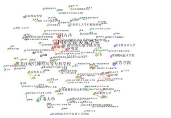
图1 高校劳动教育研究机构和合作者合作知识图谱 (2012-2020)