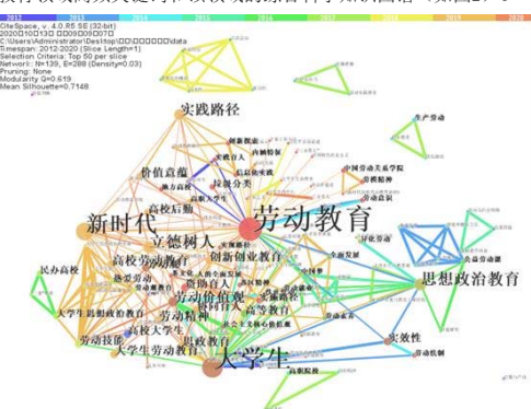
图2 高校劳动教育研究综合知识图谱 (2012-2020)

运用Citespace软件对十八大以来高校劳动教育研究文献样本的关键词进行共现分析, 得到高校劳动教育领域高频关键词和该领域的综合科学知识图谱(如图2)。