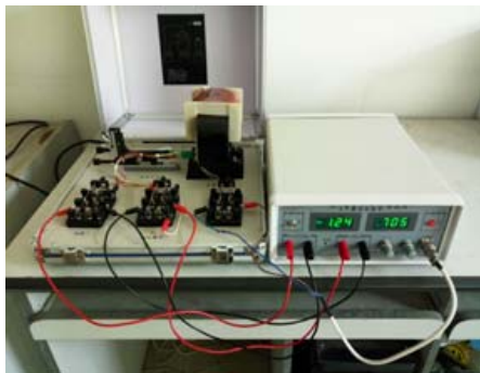
图3 霍尔效应原理及其应用实验