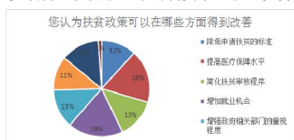
图2 大学生眼中扶贫政策如何改善

性项目的后期管理占11%。可以看出,各方面比例相差不多,其中较为突出的两项集中在医疗保障和就业两方面,这也与我国目前的社会问题密切相关,一定程度上说明了当前医疗卫生保障工作仍需进一步改善,以及就业难的现实下,就业机会亟须增加。