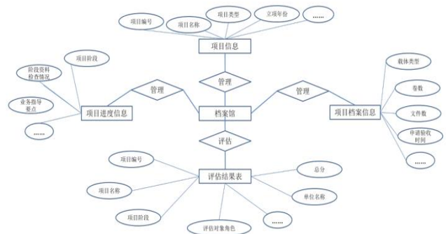
图1 基建档案质量管控反馈评估图

在进行基建档案质量管控反馈评估工作时,项目管理模块发挥着重要的基础作用,在跟进项目信息以及项目资料的基础上,在项目前期准备、项目实施、竣工验收以及后期评估阶段都可以得到有效应用,基建档案质量管控反馈评估如图1所示。对基建档案质量管控因素进行深入分析,有助于反馈评估的有效落实,人为因素属于档案质量管控最为关键的因素。建设单位在对基建档案管理基调进行设定时,需要明确验收要求以及宣贯制度规范。而建设单位投资项目管理体系中相关领导的档案管理意识,可以保障基建档案管理的顺利推进。项目资料的质量主要与资料员对项目负责人以及兼职档案员的职责定位、对归档范围的解读。项目施工以及监理单位都存在明显的人员流动问题,因此需要全方位管理相关管理人员,使其可以对该项管理工作的复杂性以及重要性有更加全面和深刻的认识 [4] 。现场资料员在收集、审核以及移交归档资料过程的业务能力直接决定了基建档案质量。另外,建设项目一般都具有突出的复杂性以及动态性特点,因此相关管理人员应当做到实时监控项目进度,对项目资料的动态变化进行有效跟踪,使项目资料收集和项目进展保持同步状态。另外,还应当注重项目资料管理过程组织机构的设置以及资料员的科学培训,并且还应当合理制定制度体系,确保资料员队伍以及资料管理体系建设具有较高的稳定性,以此来支撑施工过程中项目资料的质量管控。