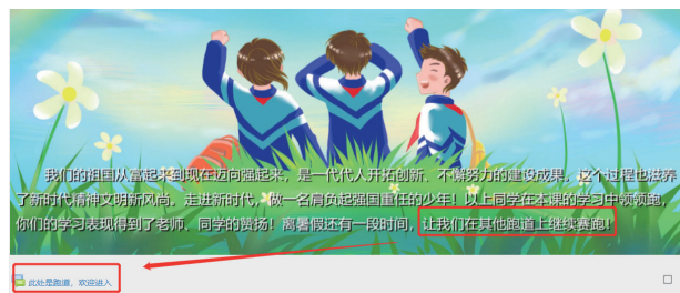
课堂延伸任务平台发布截图

可视化评价方式鼓励了学生在实践的过程中进行个性化的思考，以多样化的方式展示自己的风采。随着课程的结束，学习似乎也画上句号。其实，课堂拓展也可以通过趣味性的评价方式有效发挥延伸作用。例如本课在评选活动结束后，通过以学生成长书册的每月评价为手段，激励学生主动参与话题讨论，延续课堂的热议，并让成长手册的活动记录转变为活动评价，细微的变动，并不增加教师的负担，却能起到正面指引的作用。