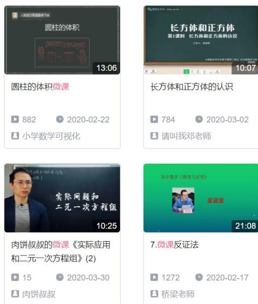
图3 利用视频网站发布或观看教学微课

教师通常要花费大量的课堂时间来讲解习题，或是占用学生的在校课余时间。但无论是哪一种，都使得教学时间不能被充分地利用，且若是利用课堂时间讲解习题，学生只选择自己想要听的题目进行学习，而其余的时间便被浪费了。不仅仅是习题的讲解，对于一些曾经讲过、却因为各种原因需要重新提的小知识点，再度花费课堂时间进行复习，效率不高。对此，微课的应用可以较好地解决这样的问题。