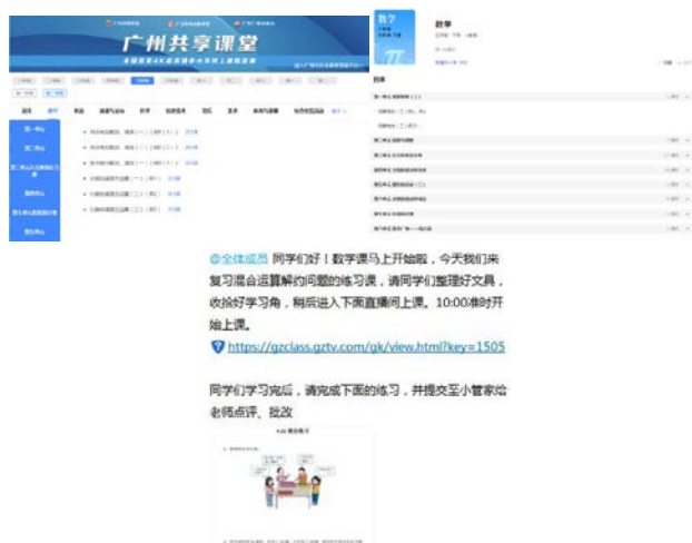
图2 停课期间,学生利用广州共享课堂和国家中小学智慧教育平台进行课程学习