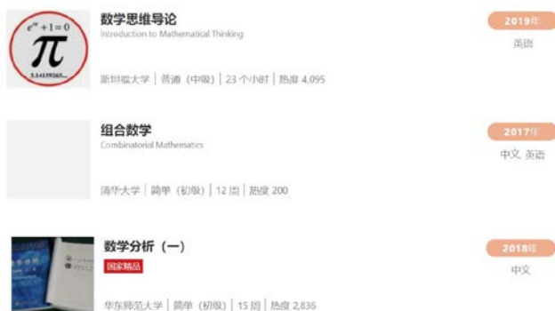
图1 在MOOC中国慕课网上学习不同大学的数学课程

微课(Microlecture),是指运用信息技术按照认知规律,呈现碎片化学习内容、过程及扩展素材的结构化数字资源。 [3] 它的主要特点有:教学时间短,教学内容较少,针对