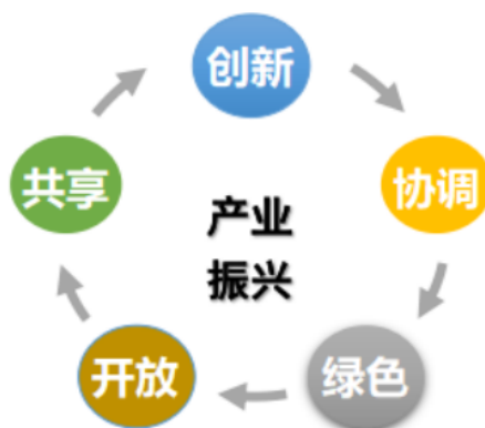
图2 产业振兴与新发展理念的关系

物、新思想进不来，里面的人不出去，是无法实现产业振兴，便无法实现乡村振兴的。共享是乡村产业振兴的本质，如果乡村产业振兴无法只是富了老板、穷了乡村，无法实现绝大多数村民生活富裕，就不是乡村产业振兴的目的。乡村产业振兴坚持共享的发展理念，让群众享受产业振兴的成果，实现生活富裕，就是坚持以人民为中心的思想，是社会主义的本质要求（见图2）。