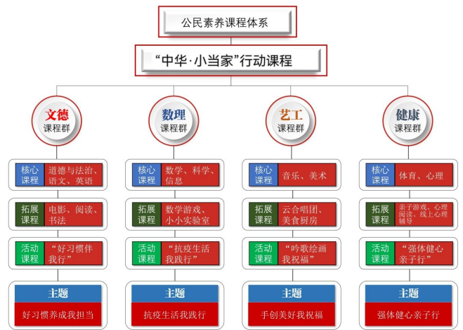
图2 “中华·小当家”行动课程框架

具体实施即将学科课程学习与时事政治相结合，语数外等国家课程的课本学习既是学生的必须也不是学习的全部。结合我校的四大课程群，将学科教学内容进行有机整合，跨学科融合，重新架构并有序实施“中华·小当家”行动课程，对学生进行爱国主义教育、健康教育、安全教育、科学艺术教育，引导学生自主学习、自主管理、自主实践，实现自主成长。一场场落落大方精彩纷呈的学生介绍、一件件童心挥洒日臻完善的学生作品、一幕幕见证中华路孩童们核心素养的发展的点滴记录陆续呈现……不仅展示了学校立足于校园文化主题的跨学科学习探索，更展示出了从中受益的中华路学子蓬勃成长的成长姿态。