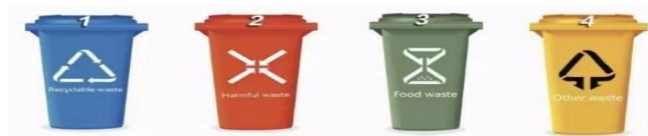
蓝色 红色 绿色 黄色

In Huizhou from 2020, we are trying to sort different kinds of waste: Recyclable waste, Harmful waste, Food waste and Other waste. We need to put them in the trash cans (垃圾桶) of different colors.