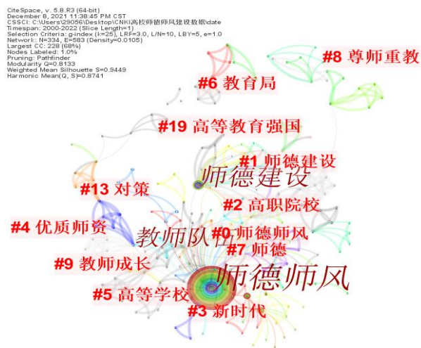
图2 2000—2022年我国师德师风建设研究关键词自动聚类标签图谱

其次，关键词聚类分析是以关键词共现分析为基础，将关键词共现网络关系通过聚类统计学的方法简化成数目相对较少聚类的过程。本研究通过 CiteSpace5.8软件进行聚类，生成关键词自动聚类标签视图（图2），共词图谱形成了19个主要聚类。其中节点数相对较多、信息量大的前6个聚类分别是：聚类#0的标签是师德师风、聚类#1的标签是师德建设、聚类2的标签是高职院校、聚类3的标签是新时代、聚类#4的标签是优质师资，聚类#5的标签是高等学校。可以说这几个研究领域一定程度代表了当前的研究热点。