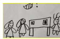
签到后养成整理习惯

我今天去签到来检查，看到很乱，我把签到本和笔整理好后才出去玩。这个是小小朋友签到完后不收拾东西才会这样的。所以我们以后签完要收拾好。