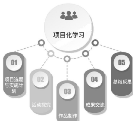
图1 项目化学习流程图

项目化学习是通过集中关注学科或跨学科的核心概念和主题，设计驱动性的问题，在学生自主或合作进行基于项目任务的问题解决过程中，积极学习和自主建构，生成知识和培养素养的一种教学（详见图2）。通过项目化的形式，将民歌这一对学生而言较为困难的主题简单化、游戏化、系统化，建立民歌知识体系。本文