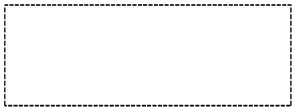
图示：多样化习作表达