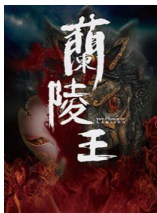
图2 话剧《兰陵王》海报,导演:王晓鹰