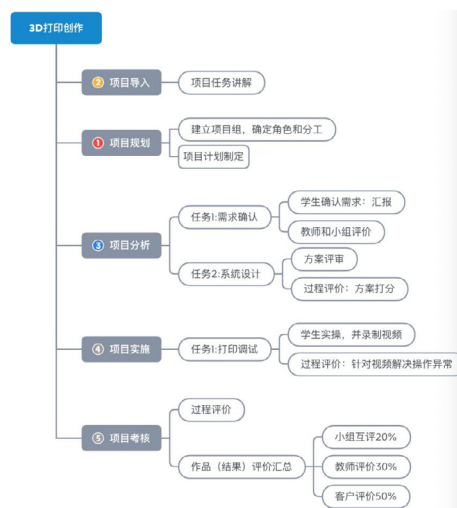
图2《3D打印创作》项目阶段活动

项目导入阶段确定项目的需求和范围,导入开发任务书。项目规划阶段,建立项目团队,为每一位学生分配角色,制订项目计划。项目分析阶段重点分析项目需求,完成系统设计。项目实施按阶段执行开发,调试和测试等任务。项目考核是综合过程和结果的评价,对项目进行复盘,形成经验总结。以创新竞赛类项目《3D打印创作》为例,其项目化运作的阶段活动,如图2所示。