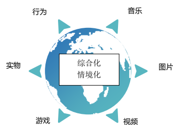
图5 学生主体型课堂导入的主要形式

如在讲授古诗《氓》时,笔者从“现代男女爱情观”的角度切入,通过2个关于爱情观的小调查,让学生在课堂一开始就爆发了激烈的讨论,充分激发了学生的学习热情,一下子拉近了这篇年代久远,略显艰涩的古诗和学生的心理距离、认知距离,对于学生把握诗歌主旨也起到了铺垫作用。