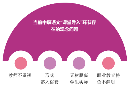
图1 当前中职语文“课堂导入”环节存在的观念问题

部分教师在导入时没有结合职业教育的特点,从学生专业发展、终身发展的角度去选择导入的内容,学生会感到语文课作为一门人文性和工具性相统一的基础学科,对其职业发展的重大影响,从而轻视语文学科。