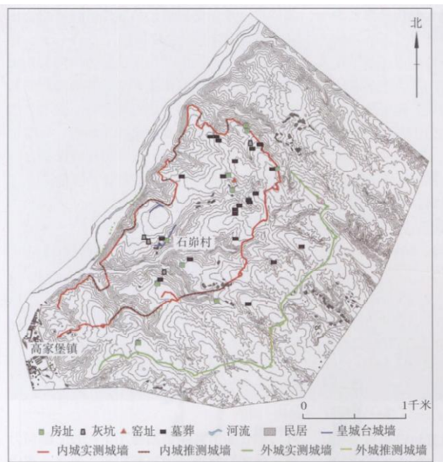
图1 石峁城墙遗迹分布图

石峁遗址被发现于1976年，位于陕西神木高家堡镇，黄土高原北部的黄河西岸，毛乌索沙漠东南角，距今四千年左右，面积约为425万平方米。同时，石峁遗址也是目前已知国内规模最大的龙山至夏时期城址。2012年发掘以后，基本确定了石峁遗址分为三部分：外城，内城和皇城台。皇城台处于整个遗址的中部偏西位置，是一个面积较小的台城，四周有阶状护坡，即依崖型城墙。内城以皇城台为中心，在四周依山势修筑城墙，形成了一个封闭的空间。外城则是在内城的东南侧，筑有不规则的弧形石墙 1 。具体分布如下图：