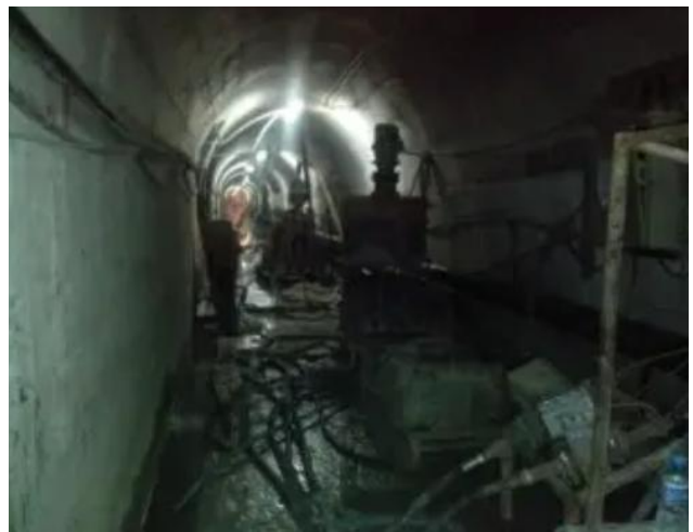
图3 灌浆施工现场图

洗孔，之后进行压水检查。上述工作结束后进行灌浆、表面抹平与修饰等工作。其中，钻孔期间穿过伸缩缝内部的止水橡皮，具体的布孔间距是25cm。在进行压水试验时，使用灌浆机等设备将孔内的水体压入到裂缝中。灌浆之前进行结合现场情况开展配比设计，本次的裂缝处理长度超过了100m。最后，经过验收检查发现，放水隧洞的渗水问题得到了有效的解决。