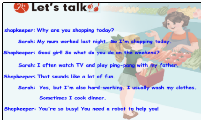
图2 PEP五年级下册Unit 1 My Day, Part B Talk 对话板块语篇

人教社教材五年级下册Unit 1 My Day, Part B Talk 对话板块就周末从事何种活动提出问题并回答展开了两个话轮,句型为: What do you do on the weekend? I often...I usually...I sometimes...这一句型也是本单元的重点句型。但学生需要在语境中理解穿插于其中的三句话: Why are you shopping today? That sounds like a lot of fun. You are so busy! 是这篇对话板块教学的难点。(教材内容查看图2.)