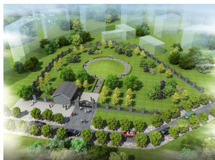
图三 九头山汉墓园区展示效果图

在环境风貌展示方面,主要通过通过对3号墓保护范围内自然环境的优化,展现墓区的幽静和庄重。在展示理念上可借鉴城市园林景观模式,结合植物多样展示,使之成为公众社区的文化景观,而非生硬、肃穆的墓区,进而构建汉墓展示与社区环境的和谐友好。