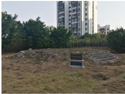
图一 九头山3号汉墓现状图

本次勘察严格依照《中华人民共和国文物保护法》《中华人民共和国文物保护法实施条例》《广西壮族自治区文物保护管理条例》和《文物保护工程管理办法》等法规文件实施。通过实地勘察发现,九头山汉墓西面和南面现已建成居民住宅小区,东面和北侧为原柳州市选炼厂旧厂区,白云路在3号汉墓东北面由西南向东北绕过。