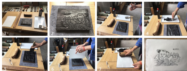
图1 印染流程介绍:(1.全部工具和整体布局。2.木版年画。3.喷水。4.倒墨。5.刷墨。6.放纸。7.鬃推。8.完成稿)

印染属于木版年画中最容易出效果的部分,适合人群非常广泛,笔者首先对整个印染流程进行详细的说明,见图1