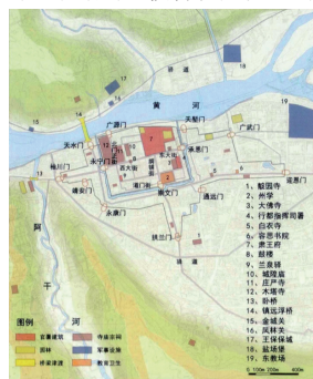
图3 明代晚期兰州城址图

从城内布局来看，城内的官署建筑以肃王府作为代表，位于城东北部，占地面积最大，达“周围三里”。行都指挥使司署作为官署主要位于城东南部。当时的寺庙宗祠主要位于城址以西，有城隍庙、庄严寺、木塔寺。教育设施如县学则主要位于城址以南。