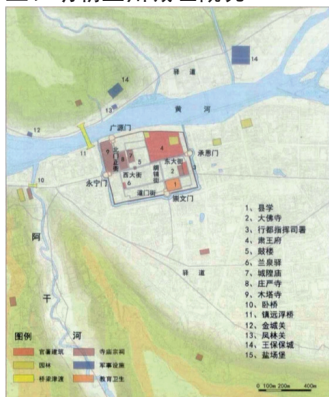
图2 明朝初期兰州城址图