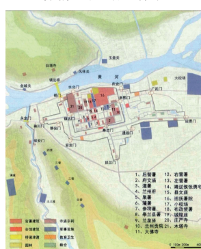
图4 乾隆时期兰州城址图