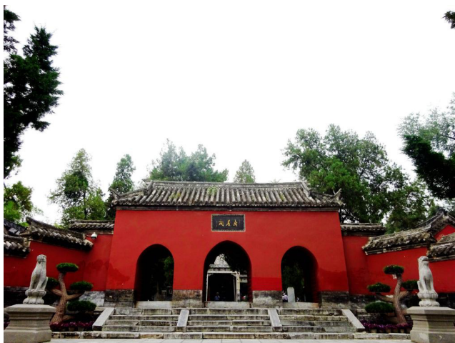
南阳卧龙岗武侯祠山门

祠内楹联匾额高悬低挂，琳琅满目蔚然成景，“三”字镶嵌其中比比皆是。其中带“三”字匾额有清代知府罗景题写的“三顾堂”、清代南阳知县刘世勳题写“功盖三分”等；美籍华人赵连仁在“千古卧龙”石碑坊二侧写下的“功德三分延汉祚，名垂千古仰威仪”；大拜殿上悬有清代南阳知府题写杜甫诗歌“三顾频频天下计，两朝开济老臣心”；古柏亭悬挂有吴佩孚撰写的“古木千章栖老鹤，使君三顾起卧龙”；三顾祠悬挂有江苏姜华撰写的“两表酬三顾，一对足千秋。”