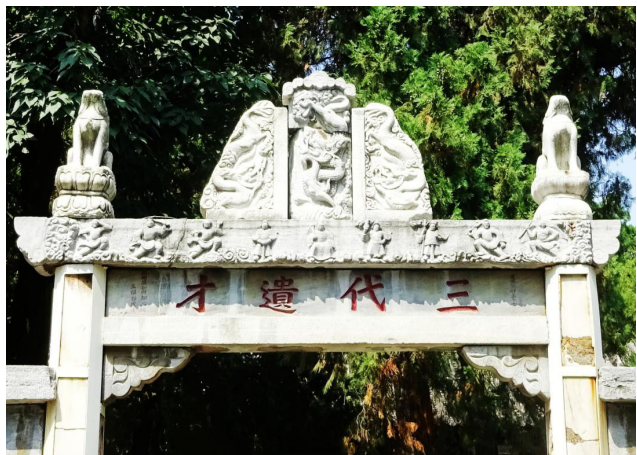
南阳卧龙岗武侯祠“三代遗才”石碑坊