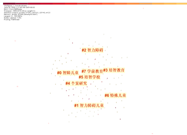
图1. 关键词聚类共现图

以关键词共现分析为基础,将关键词共现网络关系通过聚类统计学的方法简化成数目相对较少聚类的过程 [3] 。本文通过关键词聚类分析的方法对的研究热点进行分析,以探求我国智障儿童教育的研究热点主题。图9中按照中心性依次呈现了“智障儿童”“智力障碍”“培智教育”“个案研究”等7个聚类,反应了我国智障儿童教育领域的研究热点。