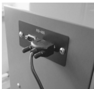
图2 MC712通讯接口实物图

性能指标符合GB、GJB、TEC60068-3-5等相关检测标准。（波动温度0.5℃），控制范围宽（温度范围-75℃~100℃），外部通讯接口为RS485。图2是MC712通信接口的物理图。