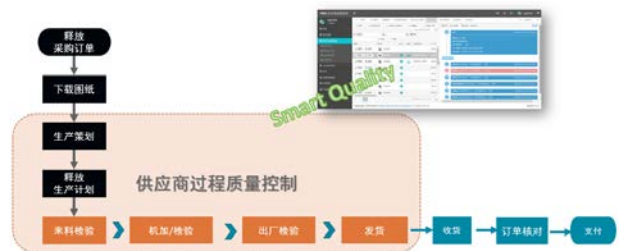
图1智慧供应链管理系统基础架构图