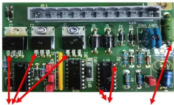
① ② ③

④如果AB塔其中之一正常工作，测量IC2的3点是否有10V电压，如果有电压再去测量IC3的3点，4点电压，如果不正确说明IC3故障。