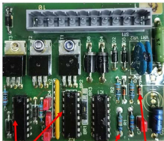
④ ⑤ ⑥

⑥用万用表通断档测量该二极管，正常情况下是0.557V左右的截止电压，反向击穿电压是2.6V左右，如果测量结果不对，那么会造成AB塔不工作。