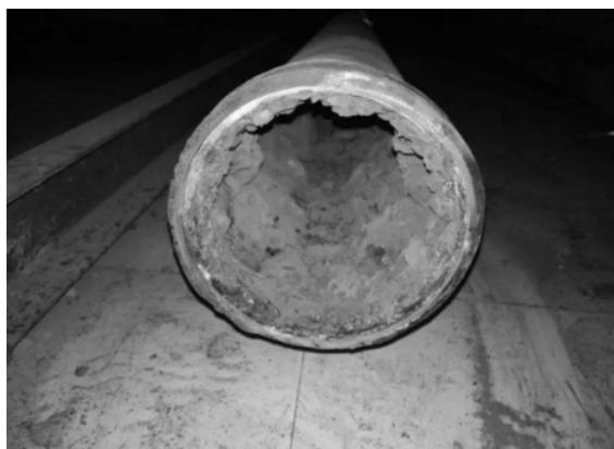
图2 老旧供水管道作用情况