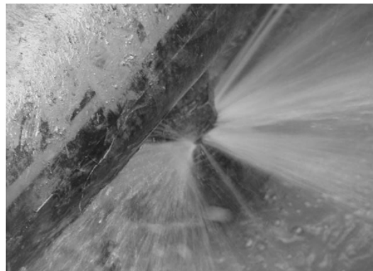
图1 供水管道破裂实际情况

的铸铁管,容易导致爆管现象发生。管道接口设施的运用,也是市政供水管道漏水问题出现的原因之一。如,采用刚性接口,其抗震能力不高,无法承担外部负荷作用下发生的变化。这里的变化是指,负荷突然增加、接口周边出现不均匀沉降。此情况下,供水管道就会发生纵向破裂或是承口处出现破裂,漏水频率大幅上涨。此外,管道内部的压力发生变化,也会造成市政供水管道发生破裂。如管道内部运行的阀门或是水泵设备,突然开闭,水会以惯性状态作用于管壁与弯头,继而引发水击现象。不仅会对管道产生震动影响,还会为管道积气提供环境条件,最终造成管道破裂。如图1所示,为供水管道破裂实际情况。