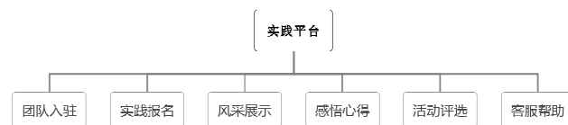
图1 社会实践平台架构

(一) 构建高校社会实践在线平台。平台开设“团队入驻”、“实践报名”、“风采展示”、“感悟收获”、“活动评选”、“客服帮助”六大模块,如图所示。通过六大模块,推动高校大学生参与社会实践,拉动平台客户容量,使得平台不断发展 [5] 。