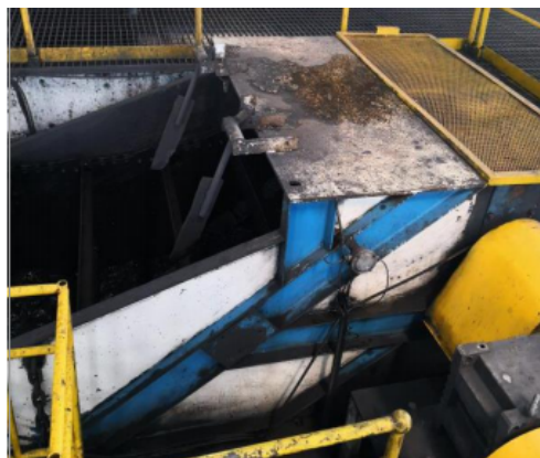
图1 重介浅槽刮板拉斜监测装置

刮板拉斜监测用于监测刮板机的跳链，出现刮板拉斜情况后及时报警停机，防止刮板拉斜后出现断链事故。刮板拉斜监测装置安装在靠近刮板机驱动机构的位置。通过监测回程刮板的运行状态判断是否出现拉斜情况。刮板拉斜监测的现场应用情况如图1所示：