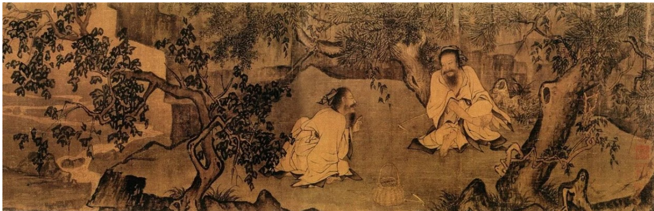
图1 采薇图 中国画（卷）绢本设色 27.2cmx90.5cm 李唐 南宋 故宫博

画家为了表现两位仁义之士的精神，营造了特别的氛围，首先在构图上，有三棵古树环绕在两个人物周围，形成画面中心的三角形构图，同时这三棵古树又象征着高贵的品质，这三棵树分别是左前方梧桐树、右前方松树、后面一人所靠柏树。人物安排上形成一个对角画面，伯夷和叔齐一左一右，一前一后，错落有致；其