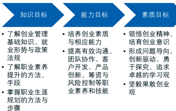
图2 大学生创业教育目标体系创新