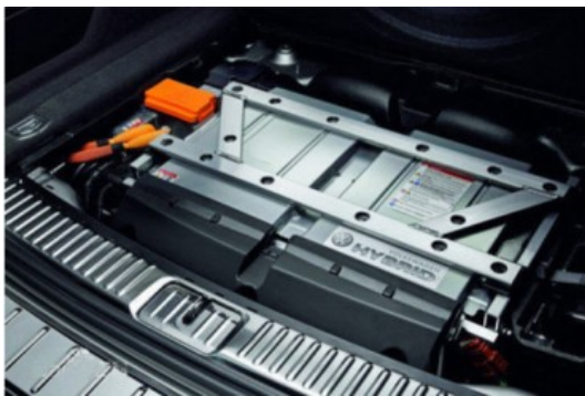
图1 新能源动力电池

在电动工程机械的作业过程中，其消耗的电能较大，因而大多数电动工程机械工作过程中需要接入380V电网以保障其能迅速的完成充电流程。一般来说，纯电动工程机械的智能化程度以及自动化程度较高，其控制器与变频器进行数据通信，根据负载变化对电机进行变频调速，并控制电磁比例阀，对斜盘变量泵的吸收功率进行调整，实现最优功率的匹配；回转时，直接应用回转电机，通过控制器与回转电机变频器进行数据通信，对回转电机进行变频调速。纯电动工程机械在工作过程中具有噪音低，环境污染低的特点。图1为新能源动力电池示意图。