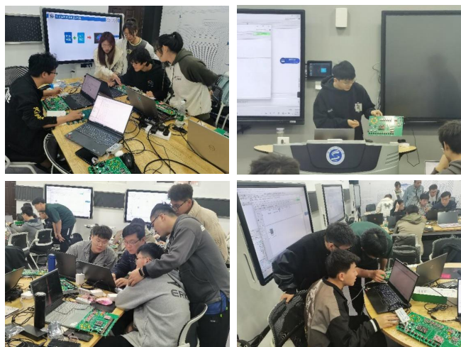
图2 学生自由开发和成果展示

导。对于学生的开发成果，进行集中展示和集中交流，交换思路，拓展视野，提高学生对RISC_V为核心的现代数字系统和数字集成电路的创新应用能力。学生自由开发和成果展示如图2所示。