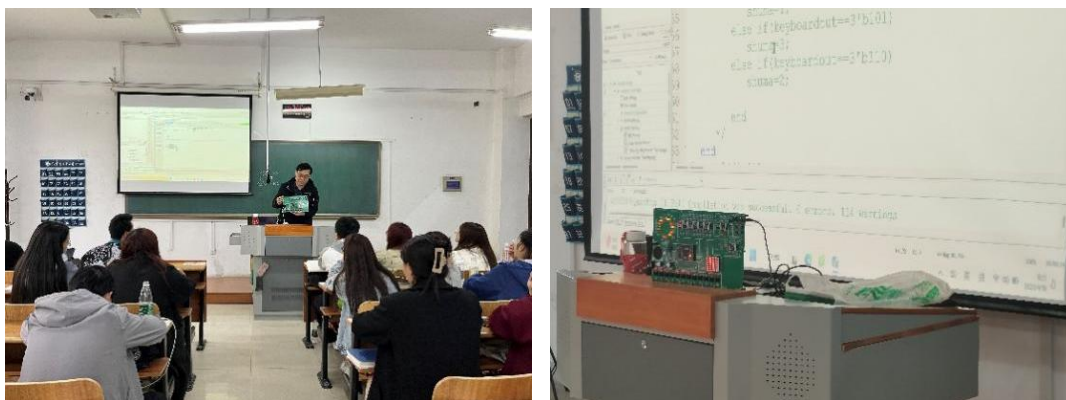
图2 特色实践训练设备在课堂教学中的应用

导。对于学生的开发成果，进行集中展示和集中交流，交换思路，拓展视野，提高学生对RISC_V为核心的现代数字系统和数字集成电路的创新应用能力。学生自由开发和成果展示如图2所示。