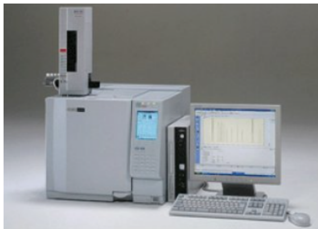
图二 某气相色谱仪