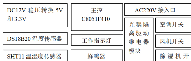
图1 温湿度控制器的系统框图

系统采用了部分较为稳定且价格实惠的元器件，如C8051F410单片机：作为系统的核心控制单元，负责数据采集和控制外部设备。DS18B203温度传感器：用于测量室内和室外温度。SY-SHT114湿度传感器：用于测量室内和室外湿度。OLED显示屏：实时显示室内和室外温湿度数据，以及外部设备状态。蜂鸣器：用于发出提示音，并点亮提示灯，以指示外部设备的工作状态。外设接口：用于控制外部设备，包括空调、风机和除湿器。有线数据传输方式：用于传输温湿度数据。其系统组成如下图1所示：