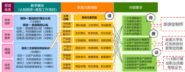
图2 课程内容体系重构图

调研后，将旅游策划升级为文旅策划技能，明晰了高职院校学生实用需求，依据认知规律，将课程教学内容分为两大模块。一是“基础知识理论认知”，帮助学生认知旅游策划；二是“文旅策划项目实训”，通过典型工作项目的专项训练，掌握文旅策划的核心技能。在教学全过程以“润物细无声”的方式融入课程思政，实现学生的全面发展。(见图2)