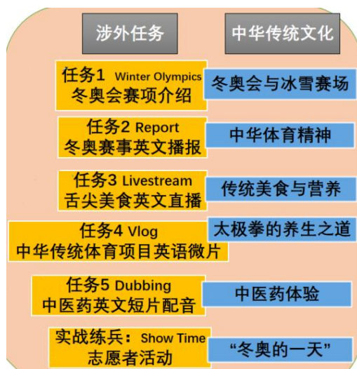
图2 单元职业场景任务中埋入的中华传统文化线

(三)问题链：新课标将语言思维能力定义为能够识别和理解英语使用者或英语本族语者的思维方式和思维特点。而“有效设计问题是提升学生思维品质的一种重要途径”（宋宁宁，2018）。因此，通过问题导向的模式形成问题链，能够帮助学生在语言输出的过程中顺延英语思维推进思考、解决问题，掌握英语母语者的思维习惯，连贯的逻辑思考和问题解决模式又反向促进