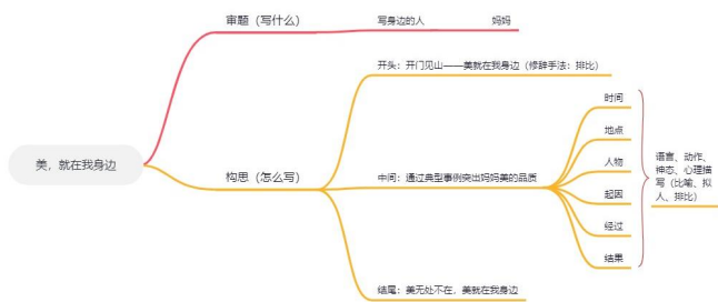
图2 语文上册第一单元的作文“美，就在我身边”遣词造句思维导图教学案例

评定一篇作文好与不好，不仅仅要看作文立意是否明确，结构是否完整，还要看作文的遣词造句。如果将作文比喻是一幢房子，作文结构是房子的框架，那么字词句就是这幢房子的砖瓦，遣好词造好句才能盖一座既实用而又美观的房子。遣词造句顾名思义指运用词语组织句子。是指写作时能够正确恰当地运用词语，并把词语组成一段通顺连贯的句子。中职学生觉得写作文难，很大程度上是学生觉得作文用词造句困难。因此，学生在确定写什么和怎么写的基础上，继续丰富思维导图，努力斟酌遣词造句，比如给名词、动词等加上相应修饰性的副词和形容词，或是加上比喻、拟人、夸张、排比、想象等修辞手法，亦或是记录一些名言名句、古诗佳句、好词好句等写作素材，在写作时加以运用，使人读起作文时形象生动，并富有画面感。例如前面举例的高等教育出版社出版的中职语文上册“美，就在我身边”，教师在明确作文主题，列好提纲后，引导学生进一步思考怎样将作文写得更加具体、生动。开头可以引导名人名言“生活中不是缺少美，而是缺少美的发现”，或用排比句，强调美就在身边；中间写典型事例时，运用恰当的语言、动作及神态描写并加以修辞手法，十分形象传神刻画妈妈的美好性格品质；结尾点题：美无处不在，美就在我身边。通过绘制可视化思维导图，学生懂得如何遣词造句，积累丰富的素材并加以运用，写作文时才可以信手拈来，一挥而就，言之有物，言之有情，使作文熠熠生辉。（图2）