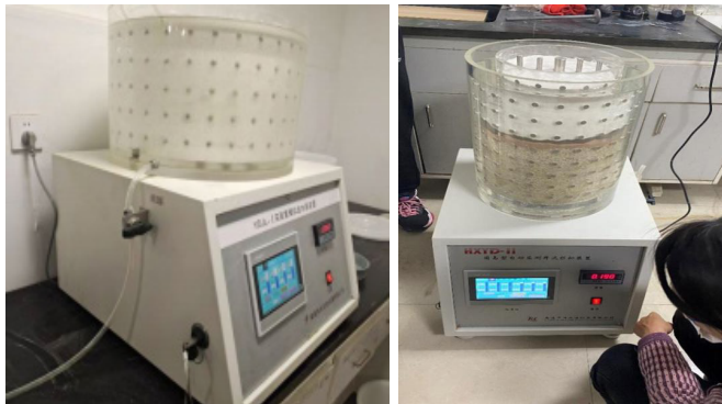
(a) 样品装填 - 潜水 (b) 样品装填 - 承压水