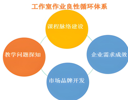
图1 工作室作品良性循环体系

工作室中不是纯属企业型工作室，而会结合不同的学情，教学目标、教学难易点等，采取任务驱动，将主题作品构思、视觉设计、形体设计、制作流程，循序渐进地开展课程教学和工作室项目建设。工作室结合市场需求、课程内容、学情学态、实践反馈等制定出一套完成作品路径。让学生带着问题实践、带着目标探索，作品布置实现课程脉络建设到教学问题探知到企业品牌开发到市场需求成效的良性循环体系。（如图1）