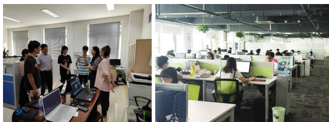
图1 实习前了解交流

实习后:在岗位实习末期,按广职院艺术设计类各具体专业特点,通过开展考核→检查→总结→反馈,全面评价艺术设计实习教学质量,综合自查问题,基于基础信息、系统数据等提出科学整改方案,总结改进实习组织实施方案,形成螺旋式上升管理闭环,实现实习管理、角色权限即时性升级。同时,为下一届学生顶岗实习做好准备,确保实习管理水平和质量的有效延续和提升(见图3)。