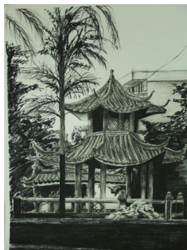
图4 校艺术文化节学生《素描写生》优秀作品

实践教学是素描课程的重要环节,它能够让学生将理论知识转化为实际的绘画能力。教师组织学生参加素描写生、设计竞赛等实践活动,让学生在实践中提高自己的素描水平和设计能力。例如:学校组织学生参与每学期举行的技能竞赛活动和艺术文化节竞赛活动,让学生积极参与《素描》项目,安排指导老师辅导学生参加竞赛,根据活动规则进行绘画创作,极大提高学生的素描能力,实践能够培养学生的团队合作精神和创新意识,提高学生的综合素质。