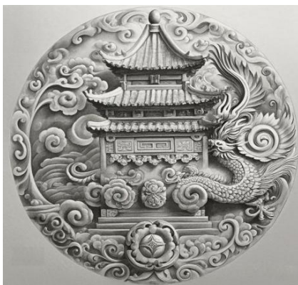
图1 传统文化元素作品

2. 融入中华优秀传统文化的元素，如中国画的水墨技法、白描风格等。通过学习和实践这些传统技法，不仅可以提升学生的绘画水平，还能够增强他们对中华优秀传统文化的认同感和自豪感。