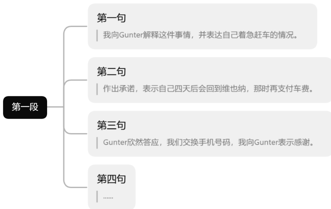
图 4 思维导图罗列故事细节

二段首句“四天后，我回到维也纳并如约给 Gunter 打电话”可知，第一段必然提到了作者所做出的承诺，再结合文章的感情基调“温情”，还应该对 Gunter 对作者的信任进行描写。由此可知，第一段会有较多的情绪描写，如作者告诉 Gunter 坏消息时的尴尬，作者提出过几天还钱时的难为情，以及当 Gunter 表示同意时，作者的感动和感激之情。第二段应该描写作者如约还钱，两人再次见面时的情形，以及文章结尾的感情升华。如图 4 所示，笔者引导学生将每个句子按照思维导图的形式进行罗列，更清晰明确地对学生细节描写进行训练。