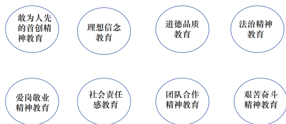
图 3-2 技工院校创新创业课程中可挖掘与融入的“课程思政”元素

在教学内容的设计中, 应该注重思创融合、专创融合, 在重视创新思维、创业精神、创新意识的基础上, 进一步重视创新创业的实践, 理论联系实际、理论指导实践。例如, 在对教学内容的设计时, 要注重以创新精神和创新意识的培养作为“课程思政”育人的主线任务, 将显性教育与隐性教育有机统一。